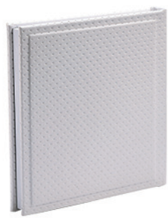
אולטרה לבן נקודות Ultra_808879