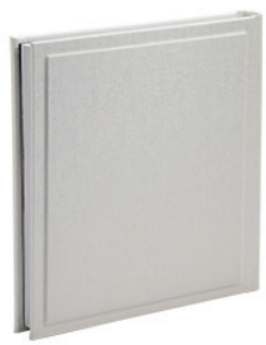
ויקטוריה לבן קלאסי Victoria_800316