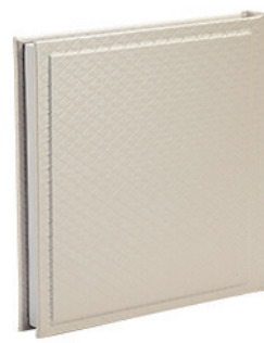
יהלום מעויינים בשמנת Diamond_800562