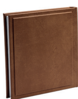
נפאל חום אדמה Naple_815004