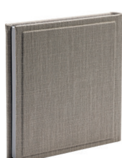
קנבס פשתן גס טבעי Canvas_500573