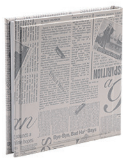
ויקטוריה עיתון Victoria_800310