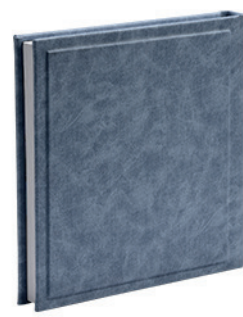
ברודווי ג'ינס Broadway_803113