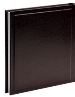
מוצארט חום ונגה Mozart_8828