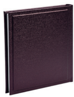
ויקטוריה חציל חבריק Victoria_800322