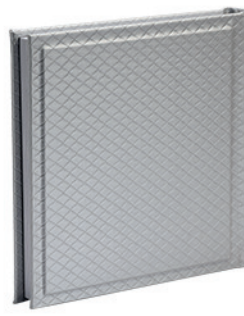
יהלום מעויינים כסופים Diamond_800566