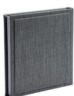
קנבס פשתן אפור עכבר Canvas_500583