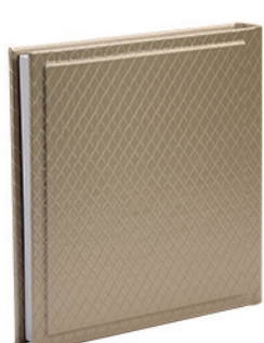
יהלום מעויינים בזהב Diamond_800561