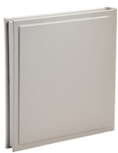
ויולה קרם קלאסי Viola_9954