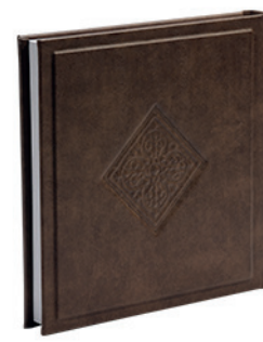
ברודווי (חום) הטבעת ענתיק Broadway_803125