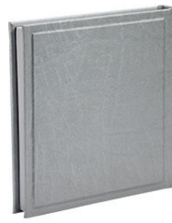
ויולה כסף מטאלי Viola_9960