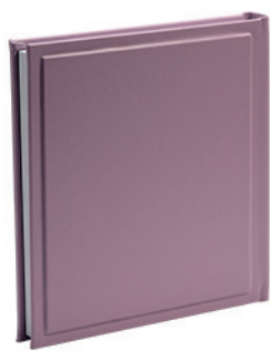
גולף סגלגל Golf_856438