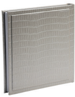
טרויה תנין זהב לבן Troya_8842