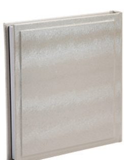
אינפיניטי שמנת נצנצים Infinity_819905