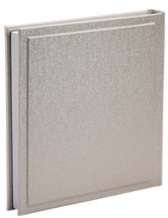
ויקטוריה זהב שמנת Victoria_800319