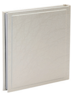
ויולה טקסטורת שמנת Viola_9959