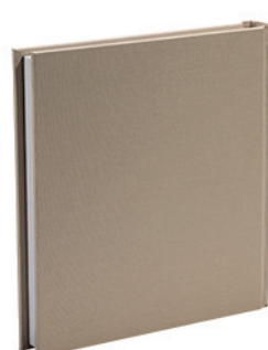
פשתן בהיר פשתן חול ים Linen_1000