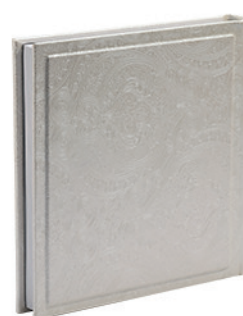
טרויה לבן פיתוחי פייזלי Troya_8836