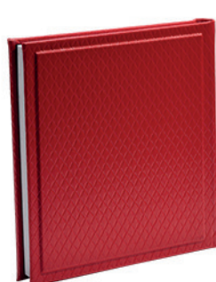
יהלום מעויינים אדומים Diamond_800567