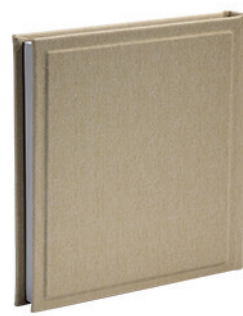
מוצארט זהב נצנצים Mozart_8848