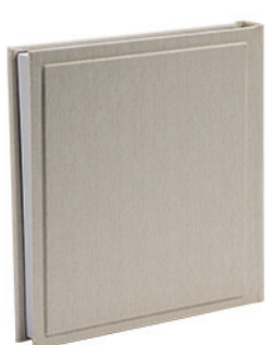
מוצארט פשתן עדין שמנת Mozart_8807