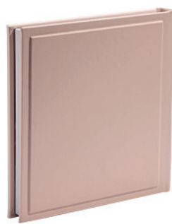
גולף ורוד פודרה Golf_856447